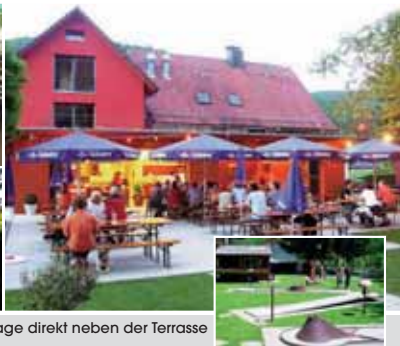
Minigolfanlage direkt neben der Terrasse